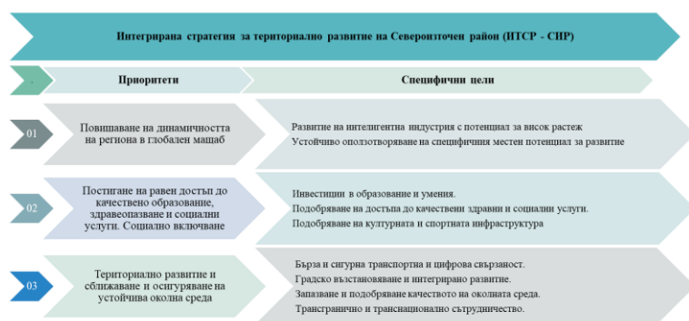
Фигура 4. Интегрирана стратегия за териториално развитие на Североизточен район

Чрез стратегическата част на ПИРО – Варна е осигурена свързаност с трите стратегически приоритета и четирнадесетте специфични цели на ИТСР – СИР.