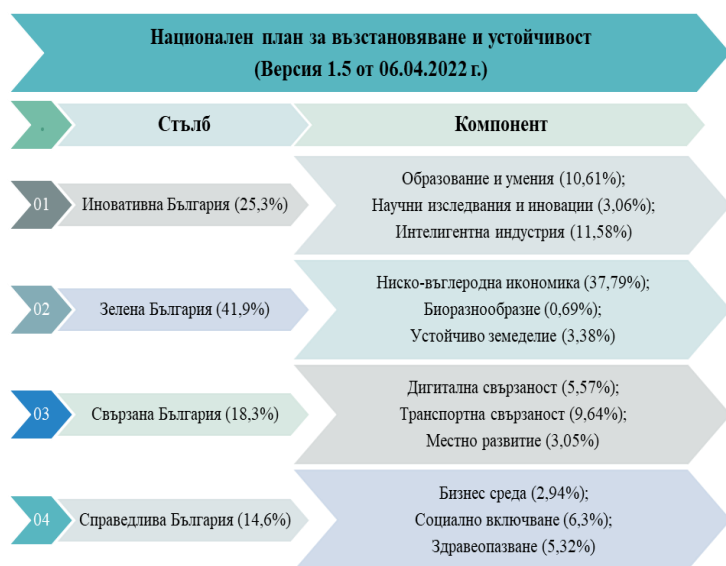
Фигура 2. Национален план за възстановяване и устойчивост на Република България (Версия 1.5. – 06.04.2022 г.)

Стратегическата рамка на ПИРО – Варна кореспондира с четирите стълба и дванадесетте компонента на НПВУ. Съобразявайки се със спецификата на територията и идентифицираните потребности са дефинирани визия, стратегически цели, приоритети и мерки, чрез които се осигурява взаимовръзката с документа.